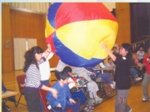
香港蜆殼有限公司義工與東華三院復康中心院友一同參與共融遊戲。

香港蜆殼有限公司義工隊於二〇〇三年十月二十六日探訪東華三院賽馬會復康中心，與復康院友一起玩遊戲，及製作手工藝、舉辦小型舞會等，此項服務不但讓復康人士體驗遊戲的樂趣，更增進復康人士與社區人士的友誼。