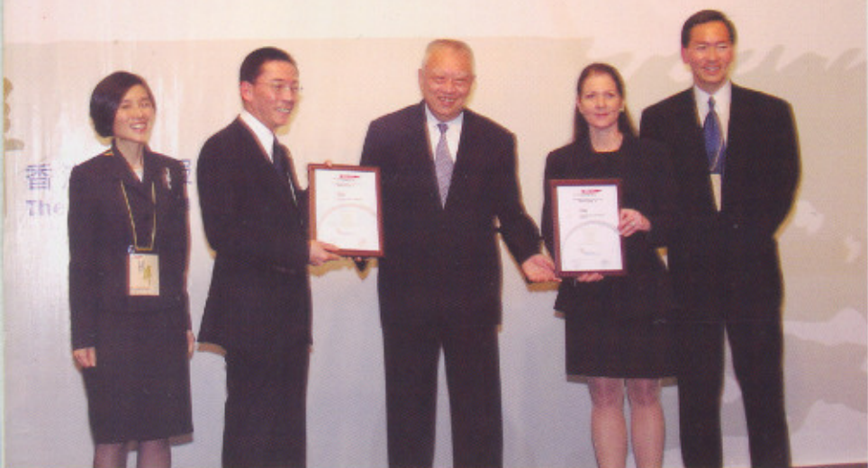
東華三院前主席楊超成先生（左二）與花旗集團香港區總裁韋嘉瑄女士（右二）共同接受香港特別行政區行政長官董建華先生（中）、香港社會服務聯會主席陳智思議員（右一）及香港社會服務聯會行政總裁方敏生女士（左一）頒發「傑出伙伴合作計劃」大獎。