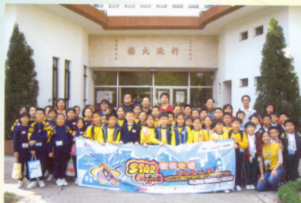
花旗集團義工協助培訓共48名小學生擔任「學生親善大使」，負責向外國遊客推廣香港的旅遊形象。

花旗集團義工由二〇〇三年十一月開始協助東華三院余墨緣綜合服務中心推行「學生親善大使英語訓練計劃」，協助帶領共四十八名小三至小五學生，進行有趣的英語訓練活動，內容包括訪問外國遊客，介紹香港旅遊景點，搜集旅遊資料等，計劃以活動教學的形式提升小學生的英語水平，並協助推動香港的旅遊形象。