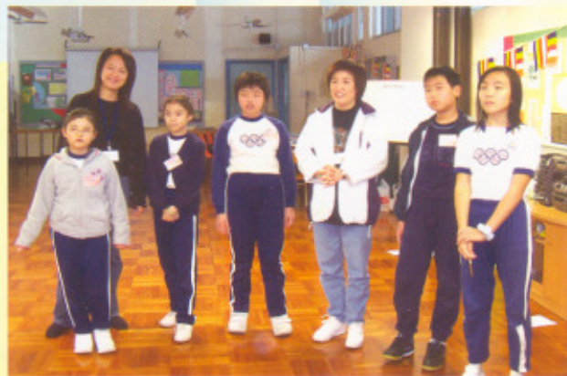
庫務署署長李李嘉麗太平紳士（後左一）親臨學校做義工。