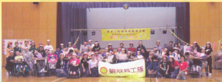
活動完結後，香港蜆殼有限公司義工與復康人士合照留念。

香港蜆殼有限公司義工隊於二〇〇三年十月二十六日探訪東華三院賽馬會復康中心，與復康院友一起玩遊戲，及製作手工藝、舉辦小型舞會等，此項服務不但讓復康人士體驗遊戲的樂趣，更增進復康人士與社區人士的友誼。