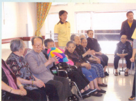
仲量聯行義工隊，不僅為東華三院方樹泉社會服務大樓提供樓宇維修服務，更與安老院的院友一起玩遊戲。