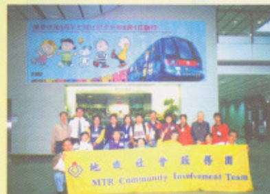
東華三院復康中心院友與地鐵公司義工隊於活動前留影。