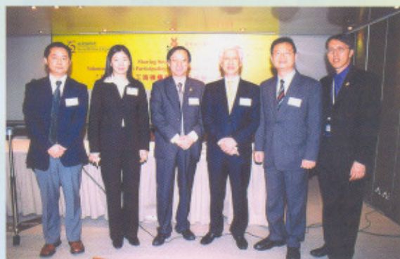
東華三院應社會福利署邀請出席義工運動「工商機構」義工服務分享會，介紹與花旗集團合作的經驗及心得。

來自企業及政府部門共20名員工參觀東華三院方樹泉社會服務大樓，了解社會服務的運作及需要。