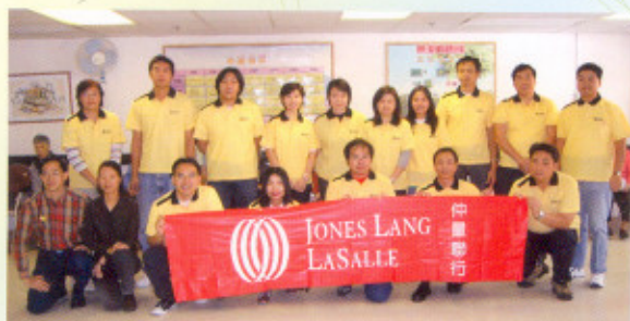
仲量聯行共派出20名義工到本院提供社區服務，於活動後留影。