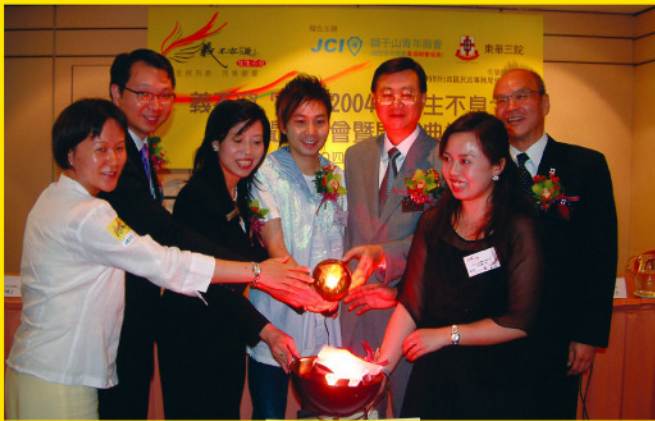
各主禮嘉賓於「義不容遲2004新聞發佈會暨開幕典禮」中公佈由香港大學社會工作及社會行政學系所進行的「香港人義工價值觀」調查結果。

為響應是次活動，大會更安排「義不容遲2004大使」啤梨哥哥帶領共30名歌迷到東華三院余墨緣綜合服務中心與過百名長者一起玩遊戲，歌迷們更親手製作精美相架送給各長者，場面溫馨熱鬧。