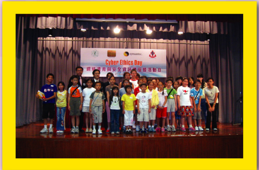
網絡德育與安全資訊活動日， 各得獎學生上台大合照。

根據警務處最新公佈的調查數字顯示，今年首季涉及網絡遊戲罪行共有52宗，主要涉及非法盜用別人帳戶、訛稱自己有某種虛擬武器、騙取他人金錢或分數等，涉案者多為18歲以下青少年。這些數字顯示青少年不正當使用互聯網所引致的嚴重後果。隨著互聯網的普及，社會各界均認為有需要讓學生了解網絡道德的重要性。