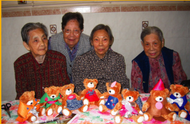
長者義工們剛完成裝扮啤啤熊，送給天水圍的小朋友。

東華三院與好心合辦「裝扮愛心小熊」計劃，活動主要發動東華三院的義工、院友及服務對象為啤啤熊穿上新衣及飾物，打扮一番。完成的啤啤熊將於十二月送贈天水圍區的兒童作聖誕禮物之用，透過送贈活動希望帶給兒童溫暖及愉快的聖誕節。東華三院共有18間服務單位，約200名義工參與是次服務，共製作超過400隻啤啤熊。