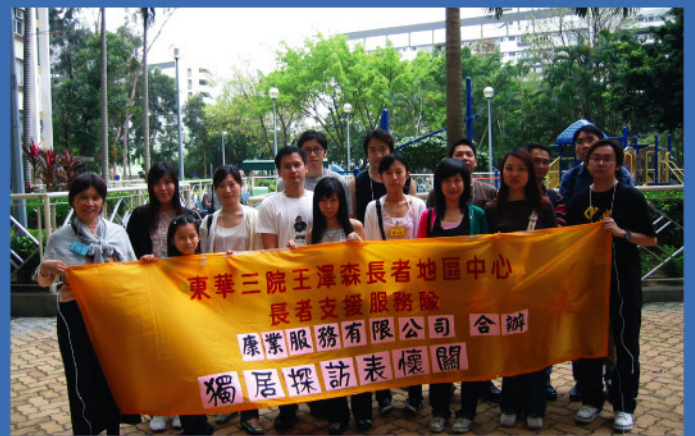
康業服務有限公司的義工隊於出發前大合照。

東華三院王澤森長者地區中心與康業服務有限公司合辦「獨居探訪表關懷」計劃，已於2004年7月24日及8月14日進行，該公司共有22名義工探訪本院25名獨居長者，其中更有兩名義工是來自該公司管理的商場客戶。透過是次探訪，義工為長者送上關懷慰問，並認識部份長者的生活需要，如申領綜援、欠缺平安鐘等，義工將有關需要向社工反映，以便跟進。