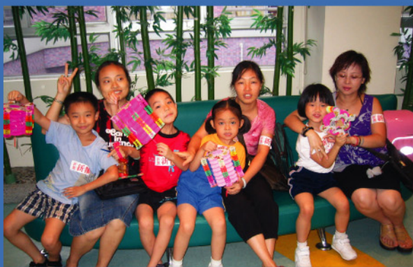
小朋友收到月餅及燈籠，顯得份外高興。