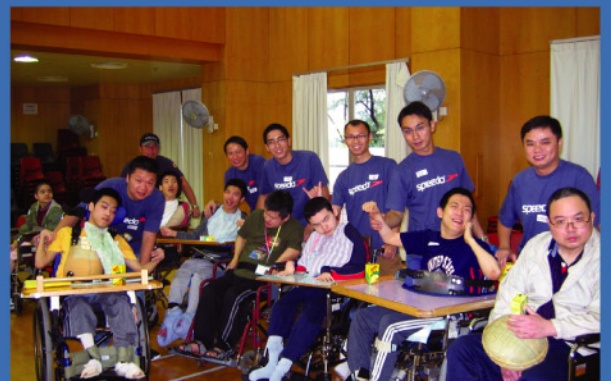
富利堡集團義工隊與院友一同玩遊戲，共渡快樂的一天。