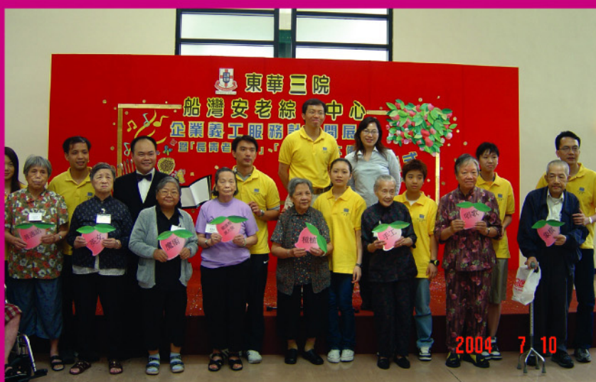
置邦物業義工與本院院友一起出席活動開幕禮暨拜師儀式，個個精神奕奕。