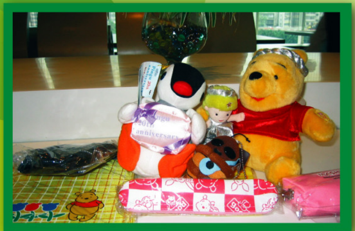
居民所捐贈的文具及玩具差不多是全新的。