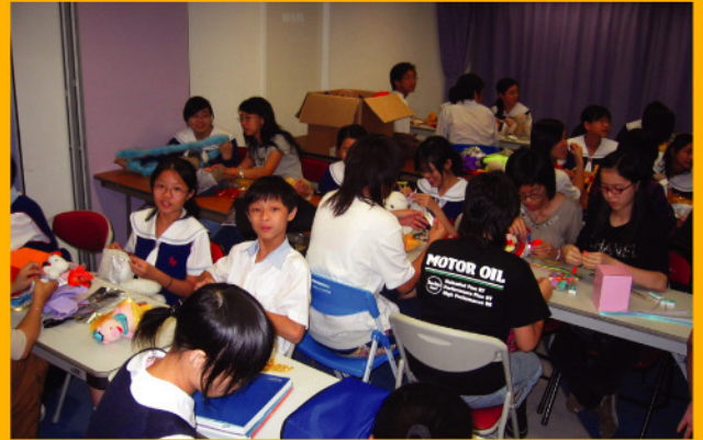
家長及學生義工一起學習製作啤啤熊服飾。