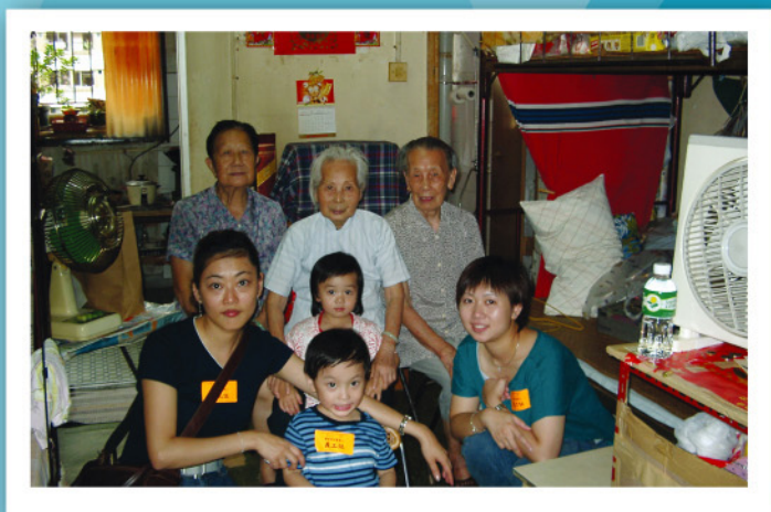
在「關懷耆老顯愛心」社區服務中，MaBelle員工與家人探訪獨居長者。

計劃的第二部份為「關懷每一天——婦女心理健康服務」計劃，同樣透過一系列社區教育活動，包括製作教育光碟、組織婦女成長小組、舉辦大型講座及嘉年華會等，推動婦女心理健康教育，提升婦女之抗逆力及情緒管理能力，幫助她們面對個人，家庭和工作等多方面的壓力。