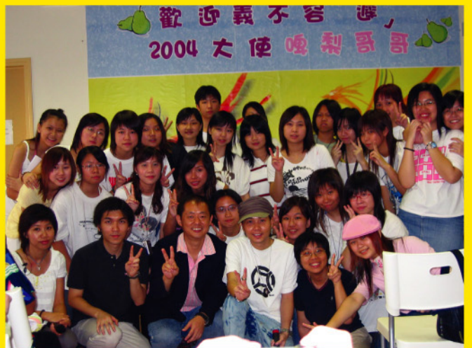
藝人啤梨哥哥與歌迷一同做義工，於暑假期間探訪本院長者。