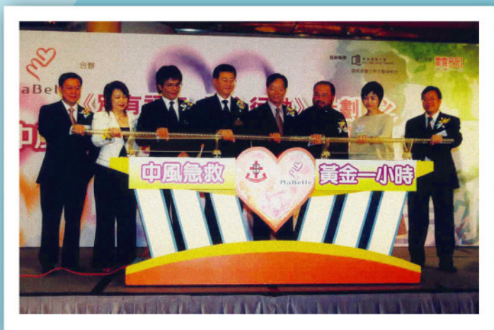
「中風急救——黃金一小時」開展禮。

是項計劃於6月份全面展開，計劃分兩部份，第一部份為「中風急救——黃金一小時」，主要針對市民對中風病缺乏認識，而中風前一小時之急救處理更為大部份市民所忽略，故希望透過一連串的社區教育活動，包括製作教育光碟、印製資料冊、舉辦講座及展覽等，加強市民，特別是護老者，對中風徵兆的認識及警覺性。