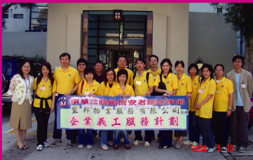
置邦物業服務有限公司義工探訪東華三院船灣安老綜合中心，於活動後留影。

置邦物業服務有限公司於2004年5月開始，協助東華三院船灣安老綜合中心推行「健康推廣大使及長青老友記」計劃。「健康推廣大使」共為中心45位院友推廣健康生活訊息，包括教授易學健體操、健康飲食知識、老年疾病知識等；「長青老友記」則以師徒制方式教授院友學習一門藝術如種植、唱歌、魔術等。有關計劃詳情及活動花絮將印製成特刊向社區人士派發，藉此宣傳「老有所為」、「老有所學」的精神。