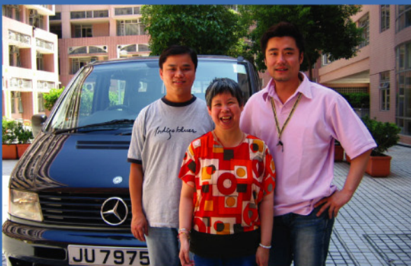
富利堡集團義工接載院友外出與家人相聚。

「多謝您」一句簡單的說話，用作感謝富利堡集團義工於2004年7月起為東華三院各服務單位院友提供義載服務，讓院友有更多機會與家人相聚及外出活動。另外，富利堡集團義工更於8月29日與東華三院賽馬會復康中心的嚴重弱能人士，一起參加「親切共融樂無窮」活動，與院友一同體驗遊戲的樂趣。