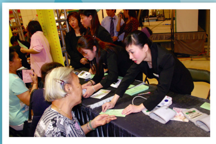
MaBelle員工於「中風急救——黃金一小時」開展禮中，為參加者量度血壓及體重。