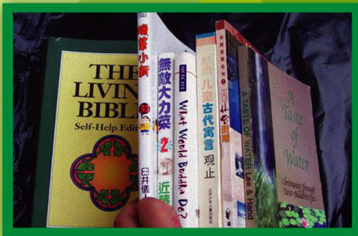
回收書籍可供低收入學童閱讀，讓知識循環再用。

是次活動反應非常熱烈，本院共收到超過三十箱的回收物品，所捐贈的玩具、文具、書籍差不多是全新的。