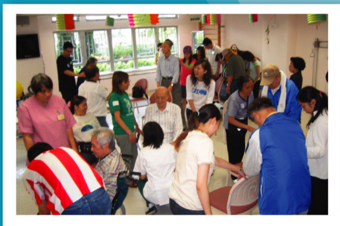
為鼓勵中風人士多做復康運動，MaBelle員工參與「關懷健康慶中秋」社區服務，與中風人士及護老者同做健身操。