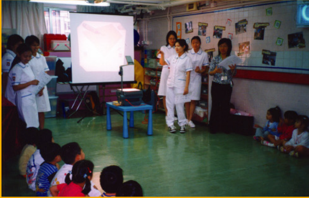
導師向幼兒介紹預防傳染疾病的常識及資訊。

香港大學護士學系師生於2004年5月21日探訪東華三院羅黃碧珊幼兒園，為學童舉辦「預防傳染及非典型肺炎」講座。透過短講、小組討論、遊戲、以及填寫衛生常識問卷等，教導學童如何配戴口罩，清潔雙手以及預防傳染病，希望培養兒童良好的健康及衛生習慣。