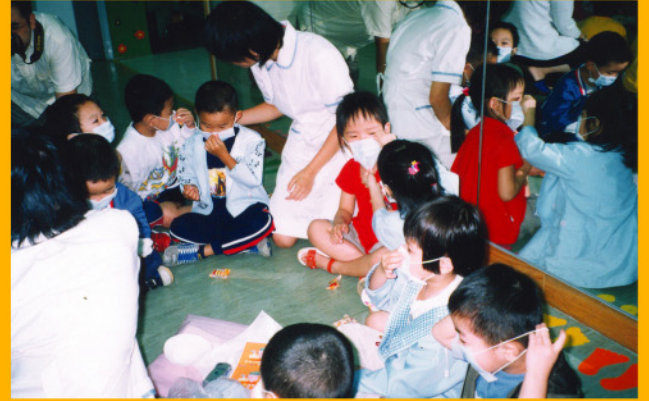
香港大學護士學系學生透過遊戲，教導學童如何配戴口罩。