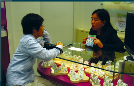
MaBelle員工向客戶推廣「別有福氣 愛心行動」計劃，並募捐有關活動經費。