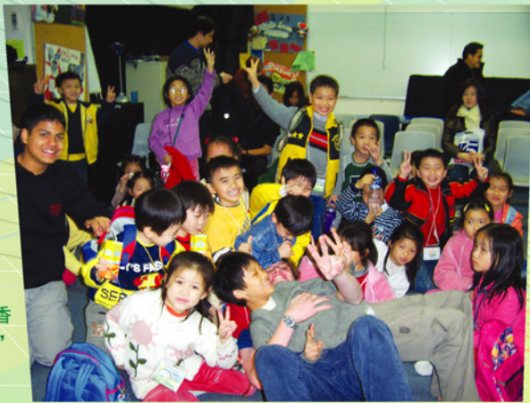
律師義工帶領學生參觀香港李寶椿聯合世界書院，於校園內留影