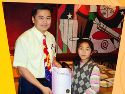
學生享用美味薄餅，一同分享閱讀成果。

為推動閱讀風氣及提升本地學生的語文水平，東華三院與香港必勝客合辦「Pizza Hut 閱讀獎勵計劃」，計劃於東華三院轄下共二十二間小學、兒童中心及綜合服務中心舉行。參加計劃學生凡於指定時間內完成最少三份讀書報告，將由香港必勝客頒發獎狀乙張，學生憑獎狀可到全港任何一間必勝客餐廳免費換領迷你薄餅一件，以示鼓勵。獲頒獎狀的學生共有5,500名，不但可免費換領迷你薄餅一件，更得到必勝客餐廳經理及員工的祝賀和鼓勵。