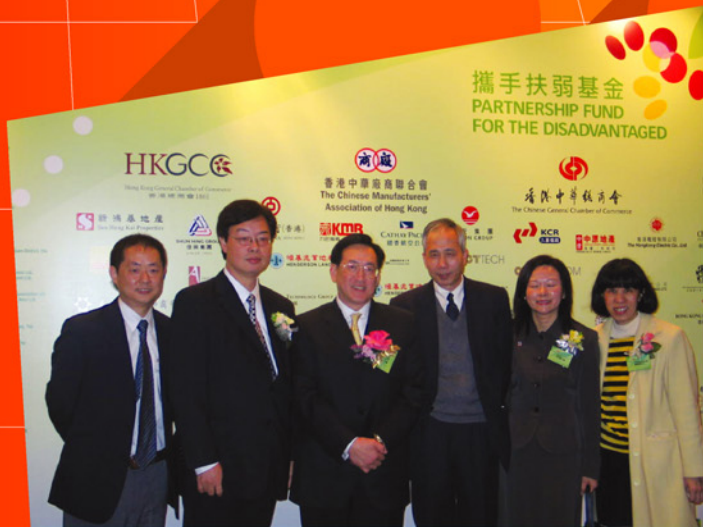
分享會後與衛生福利及食物局長周一嶽醫生SBS太平紳士合照

「東華三院樂聚亭戶外咖啡店」是本院黃竹坑服務綜合大樓與巴黎咖啡店(Paris Café)銅鑼灣特許經營店攜手合作的社會服務計劃，由2004年9月至今，咖啡店為本院精神病康復者、退休人士以至長者提供工作實習、創業及營銷的平台，學員透過學習咖啡調配、製作小食，參與店舖管理等工作，學習提升個人技能及營商知識。