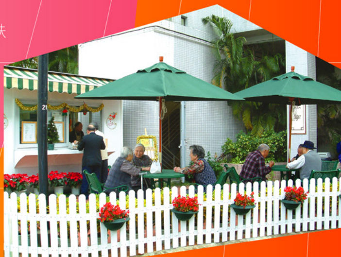
東華三院樂聚亭戶外咖啡店外觀

3月7日，東華三院獲 社會福利署 邀請於「攜手扶弱基金」開展禮上，分享與巴黎咖啡店的企業合作經驗，透過此類有意義的計劃，本院希望將企業的社區參與以及如何有效運用社會資本、服務弱勢社群的經驗向各界分享，希望鼓勵社會上更多愛心僱主投入義工行列，回饋社會。