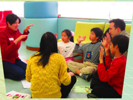
香港律師會年青律師義工每星期探訪深水埗區學童，與他們一起遊戲及學習英語

東華三院與香港律師會年青律師小組合辦「生涯導師計劃」，計劃主要招募年青律師擔任「生涯導師」，定期探訪深水埗區的貧童，教授他們英語並提供生活及成長上的輔導，服務內容包括：趣味英語學習、營養講座、旅遊大使訓練、參觀國際學校以及社區服務等，希望憑藉律師義工的豐富人生經驗，引領低收入家庭兒童奮發向上，健康成長。