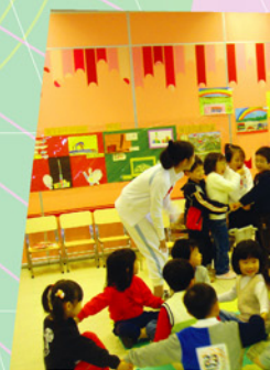
花旗集團義工巡迴到東華