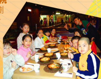
香港必勝客餐廳經理頒發獎狀予計劃學生。

為推動閱讀風氣及提升本地學生的語文水平，東華三院與香港必勝客合辦「Pizza Hut 閱讀獎勵計劃」，計劃於東華三院轄下共二十二間小學、兒童中心及綜合服務中心舉行。參加計劃學生凡於指定時間內完成最少三份讀書報告，將由香港必勝客頒發獎狀乙張，學生憑獎狀可到全港任何一間必勝客餐廳免費換領迷你薄餅一件，以示鼓勵。獲頒獎狀的學生共有5,500名，不但可免費換領迷你薄餅一件，更得到必勝客餐廳經理及員工的祝賀和鼓勵。