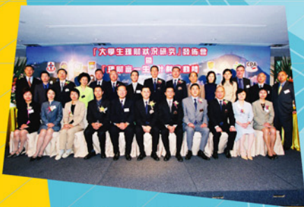
嘉賓於「理財富一生」大學生理財教育計劃啟動禮儀式後合照。

於二〇〇四年十月八日舉行此新聞發佈會，與社會各界人士分享有關的研究成果，並藉以引起各界對大學生健康理財活動的關注及支持。