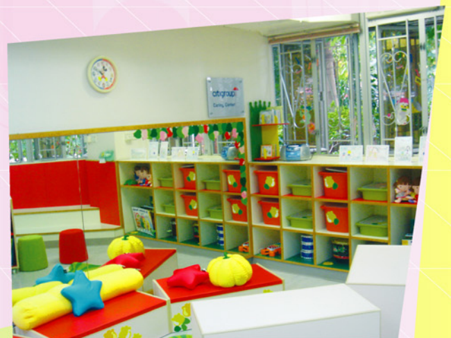
Citigroup Caring Corner

花旗集團共撥款$320,000元予本院伍尚能紀念幼兒園、方樹泉幼兒園、捷和鄭氏幼兒園及余墨緣綜合服務中心購買電腦、電視、圖書以及教育軟件等器材，並成立Citigroup Caring Corner，希望鼓勵幼兒閱讀課外書。除了購買所需設備外，花旗集團更組織義工隊，巡迴到東華幼兒園講故事，希望藉此啟發幼兒的想像空間及與幼兒分享閱讀的樂趣。