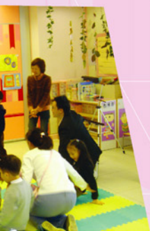
東華幼兒園講故事