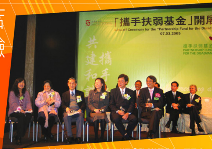
東華三院獲邀於社會福利署「攜手扶弱基金」開展禮上，分享與巴黎咖啡店的成功合作經驗