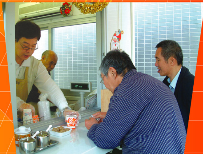
巴黎咖啡店員工義務為本院提供營銷技巧知識及培訓

整個計劃，東華三院與巴黎咖啡店無論在構思、籌備以至營運方面可謂合作無間。例如巴黎咖啡店為本院提供咖啡豆及糕點製作技術，分享營商知識，為本院院友提供調配咖啡、製作食品及店務管理等訓練。在短短幾個月間，「樂聚亭」成為弱勢社群最佳的工作實習場所；透過合作，巴黎咖啡店亦增加對東華社會服務的認識，有助啟發他們設計新食品意念。