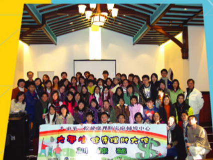
熱心的大學生在完成訓練後，肩負起推廣健康理財的訊息。

加深大學生對自己的理財模式的了解，從而培養出正確的理財態度。在完成訓練後，他們便成為本中心的「大學生健康理財大使」，協助本中心推動更多理財社區教育活動。