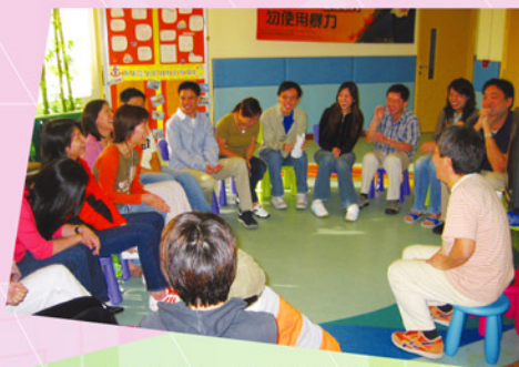
「雄仔叔叔」教導花旗集團義工講故事的技巧和方法