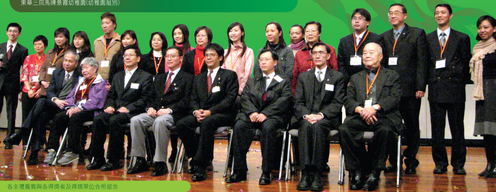
各主禮嘉賓與各得獎者及得獎單位合照留念