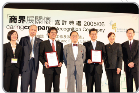
東華三院與香港會計師公會合辦「健康理財家庭輔導計劃」獲頒「傑出伙伴合作計劃獎」