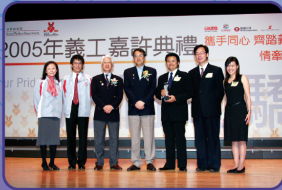
東華三院與巴黎咖啡店合辦「關懷計劃」，獲社會福利署頒發「2005年工商機構義工服務計劃比賽」冠軍，並接受社會福利署署長鄧國威太平紳士(中)的嘉許

東華三院去年榮獲社會福利署頒發「2004年最高服務時數獎(公眾團體)季軍」，全年義工人數為41,357人，義工服務總時數達1,153,341小時。另外，本院賽馬會樂群家居訓練及支援服務義工冼國平先生及樂思兒童之家義工劉勵儀女士分別獲社會福利署頒發「2004年最高服務時數獎」，為復康及婦女組別最熱心之義工。除此之外，東華三院黃竹坑服務綜合大樓與巴黎咖啡店合辦「關懷計劃」更獲社會福利署頒發「2005工商機構義工服務計劃比賽」冠軍。有關獎項已於2005年12月10日假香港理工大學賽馬會綜藝館接受行政長官夫人曾鮑笑薇女士及社會福利署署長鄧國威太平紳士的嘉許。