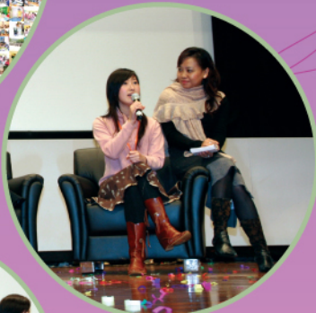
得獎義工分享助人的歷程和感受