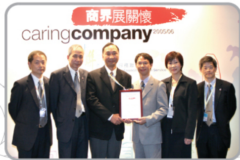
東華提名合作企業及伙伴參與香港社會服務聯會「商界展關懷」標誌提名計劃，企業代表於會後留影